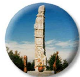
Denkmal in Bruchhausen